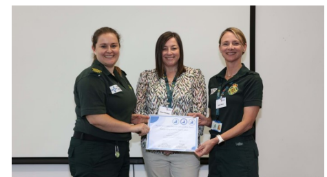
WAST Safeguarding Team