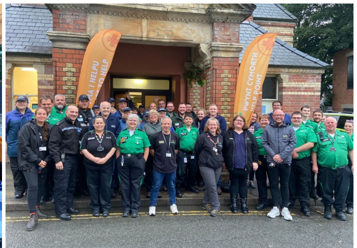
Rhai o'r tîm gweithredol y tu allan i Bwynt Cymorth Llanfair-ym-Muallt