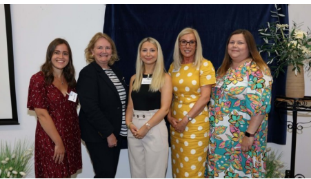
Hywel Dda University Health Board