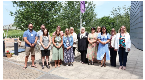
Group Photograph of Attendees