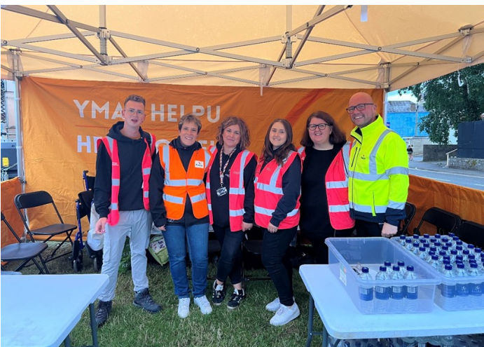
Gweithwyr Ieuenticid Cyngor Sir Powys ym Maes Parcio'r Groe

Gellir gweld fideo sy'n amlygu gwaith y grŵp yn: https://www.youtube.com/watch?v=al_dHBoxvkc&t=17s