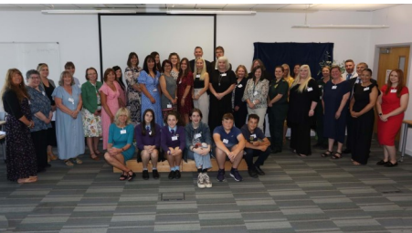
Group Photograph of Attendees